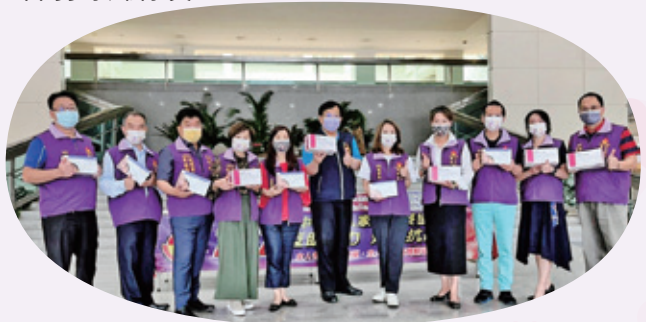
捐贈新冠肺炎快篩劑