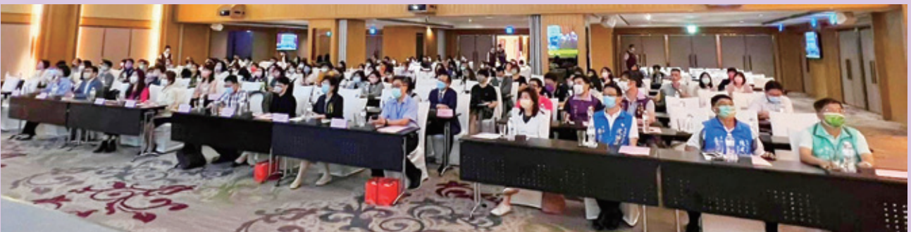
多元入學適性發展座談會