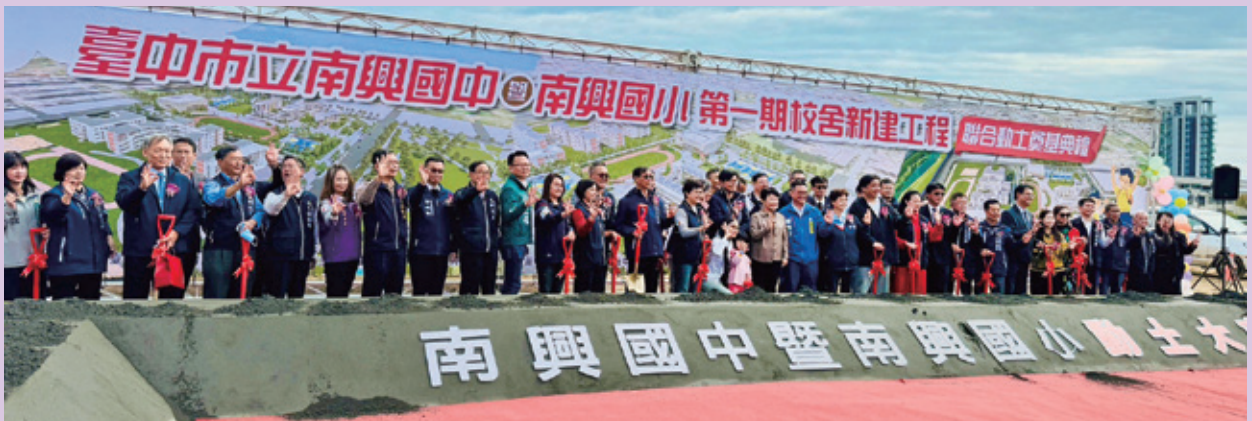
南興國中小第一期動土