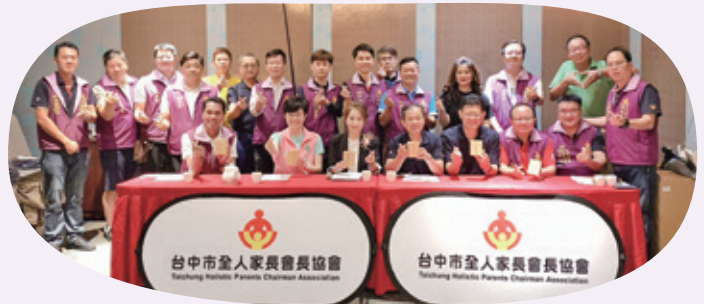
112 年 5 月份理監事聯席會