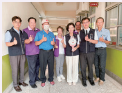
協助廓子國小新生開學