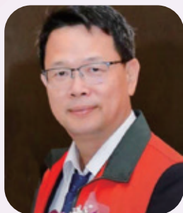
第 3、4 屆 吳和城