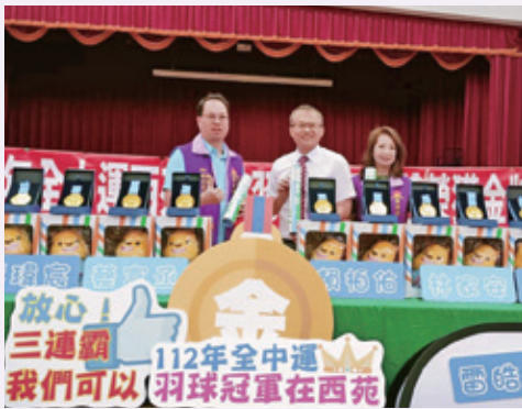
西苑高中全中運二連霸