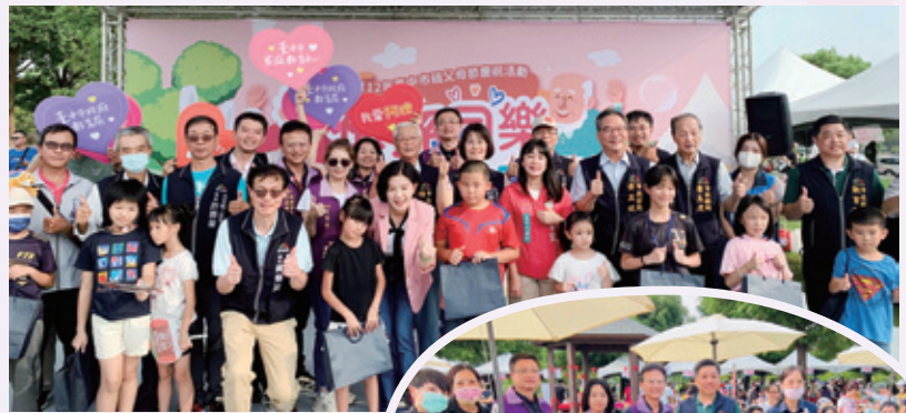
916 台中市祖父母泡泡節