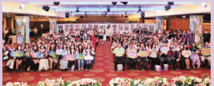
「幸福滿園發現台中之美」系列創作徵圖比賽