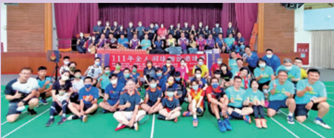
111 年全人公益羽球賽