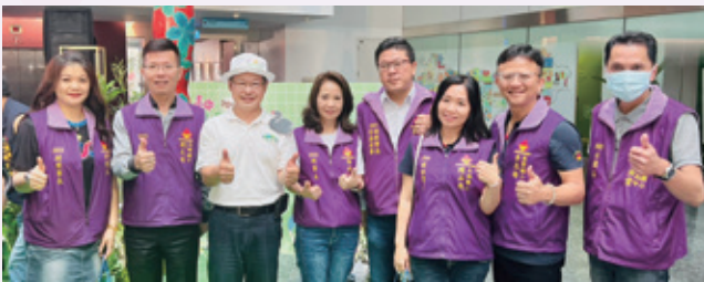
台中市民野餐日主題曲發表會