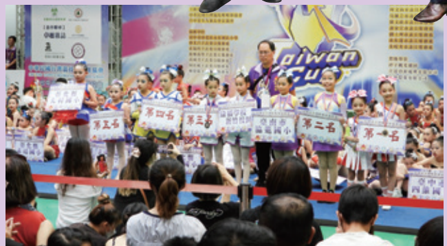
7月全國啦啦隊錦標賽