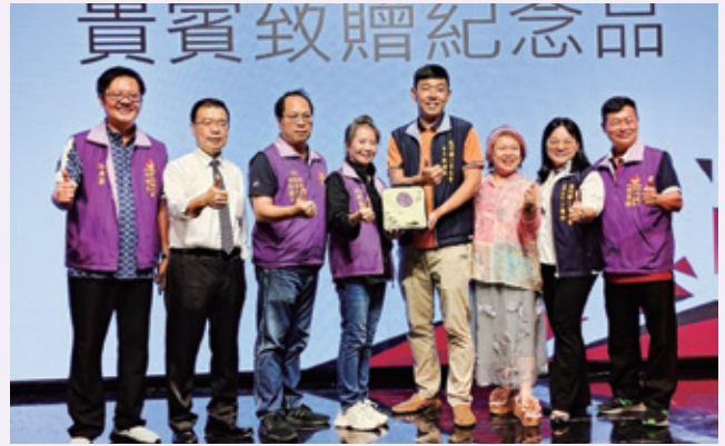
篤行會長交接典禮