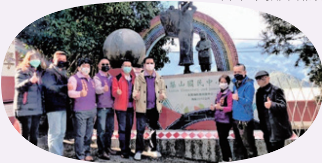
梨山國中暨偏鄉學校贈送慰問金