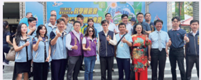
111 學年度台中市中小學科學教育園遊會