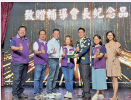
永春國小會長交接