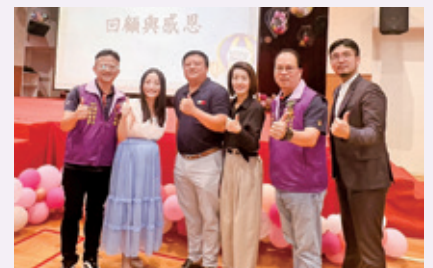
華盛頓高中畢業典禮