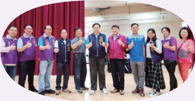
台中市教師職業工會羽球錦標賽