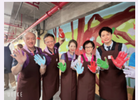
異想世界牆面彩繪