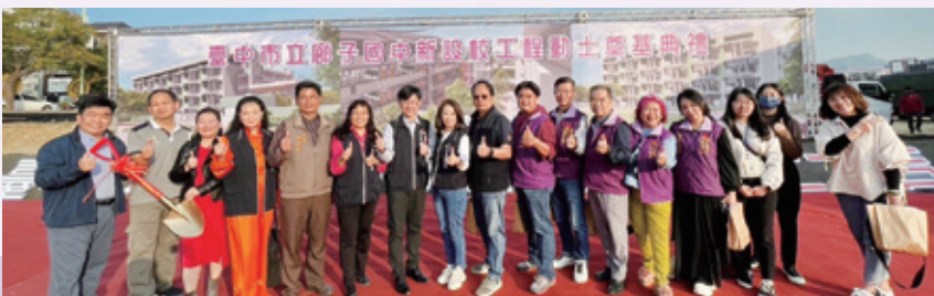
廓子國中動土典禮